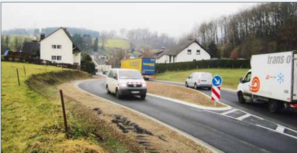
Kreisstraße 7 in St.Claas, In der Wörde.

Ein sehr hohes Verkehrsaufkommen gibt es bereits auf der Kreisstraße von Grevenbrück nach Heggen. Im Bereich St. Claas/ In der Wörde sind Maßnahmen umgesetzt worden, um den Verkehr zu verlangsamen und die Verkehrssicherheit zu erhöhen. (s. Bild) In Dünschede sehen wir noch erheblichen Handlungsbedarf. So fehlen im Bereich der Bushaltestelle „Schützenhalle Dünschede“/ Im Weingarten Querungshilfen wie z.B. Fahrbahnteiler, die zur Schulweg-sicherung dringend erforderlich sind. Im Bereich des Ortsausgangs, Richtung Heggen muss der Verkehr beruhigt werden. Vor allem die schwachen Verkehrsteilnehmer wie Schulkinder und Fußgänger sind zu schützen, aber auch ein gefahrloses Auffahren von den Grundstücken auf die Kreisstraße ist zu ermöglichen.